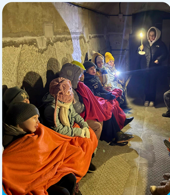
Діти перебувають в укритті під час повітряної тривоги у Броварах. Приклад фотоконтенту для міжнародної аудиторії