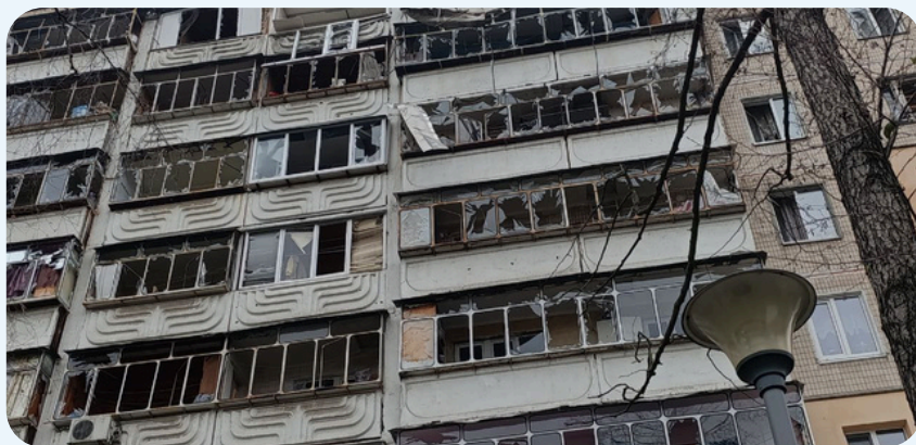
Наслідки одного з російських обстрілів, Київ.

Протягом місяця відбулося чотири масовані ракетно-дронові удари (9, 13, 20 та 24 січня), переважно спрямовані на енергетичну інфраструктуру м. Київ . У межах цих атак було застосовано 148 ракет різних типів, з яких перехоплено 69 (46%). Відносно низька ефективність перехоплення пояснюється виснаженням систем протиповітряної оборони та складністю протидії балістичним ракетам. Удари по енергетичній інфраструктурі призвели до аварійних відключень електро-, тепло- та водопостачання в низці регіонів.